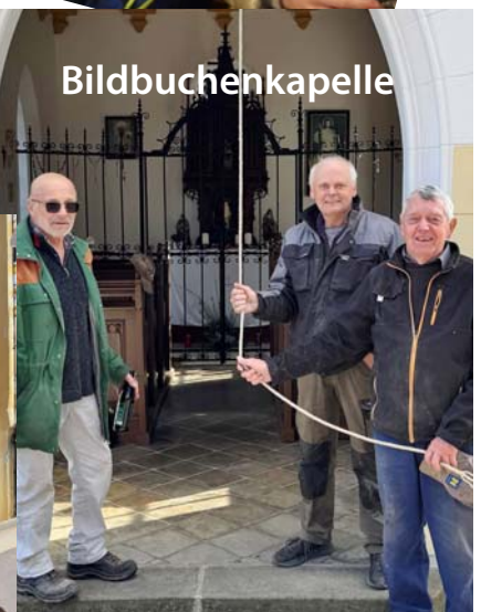
Dank unserer Helfer funktioniert die Glocke in der Bildbuche wieder. Danke