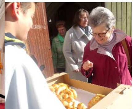
Gute Peregrinikipferl im Anschluss an die HI Messe im Gedenken an den HI. Peregrin am letzten Sonntag im April.